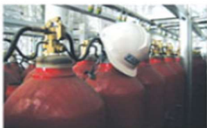
▲ CO 2 Cylinder Assembly

ZBG 型高压二氧化碳灭火系统由 CO 2 储液瓶组、遥控释放站、释放阀、报警单元、喷头及管路阀门阀件等组成。系统采用气动和手动操作方式启动，气动操作方式通过打开遥控释放站内的两只氮气瓶，一路氮气通过控制管路开启释放阀，另外一路自动延时 20~40s 后，开启 CO 2 气瓶瓶头阀，释放出灭火药剂灭火；手动操作方式通过直接手动开启释放阀及瓶头阀的应急操作手柄，释放出灭火药剂灭火。