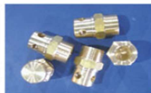
▲ CO 2 Nozzle