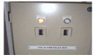
▲ Alarm Relay Box