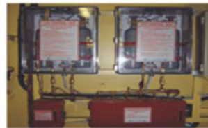
▲ CO 2 Control Box Unit