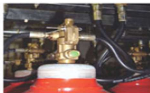
▲ Cylinder Valve Assembly