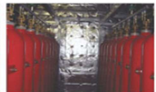
▲ Manifold Assembly