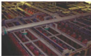
▲ Main Pipe Assembly