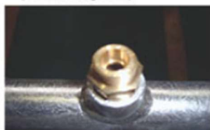
▲ Check Valve