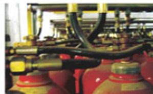
▲ Pilot & Flexible Hose Assembly