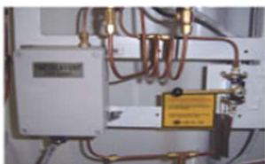
▲ Time Delay Unit