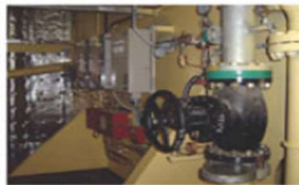
▲ P.O.D Valve Assembly (Main Isolating Valve)