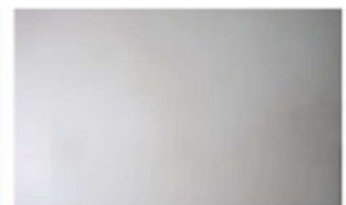
▲ CO 2 Gas Discharging